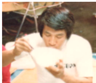
↑「米のメシはついてくる！」 熊本アマチュア無線クラブの移動運用にて。

くまもとトゥデイ 平成4年10月5日号より 転載にあたりコスモ出版様より快諾をいただきました。